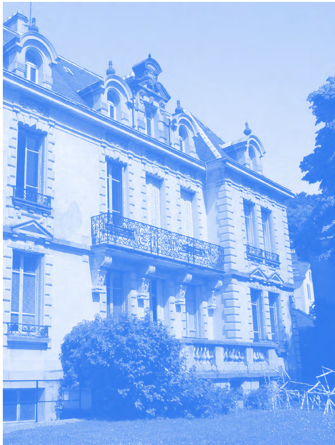
Bâtiment ÉSAL Pôle arts plastiques Épinal vue de face

Les Journées Professionnelles sont des moments privilégiés pour aborder avec des professionnels de l'art les préoccupations liées à l'entrée dans le monde du travail. L'ÉSAL, caractérisée par son attachement constant au territoire, est aussi ouverte aux échanges transfrontaliers et internationaux qu'elle élargit tous les ans. Les valeurs fondamentales de l'enseignement à l'ÉSAL reposent sur un engagement fort de tous ses acteurs, mais aussi sur une écoute et un investissement précieux de ses fondateurs : les communautés d'agglomération de Metz Métropole et d'Épinal et le Conseil Régional de Lorraine.